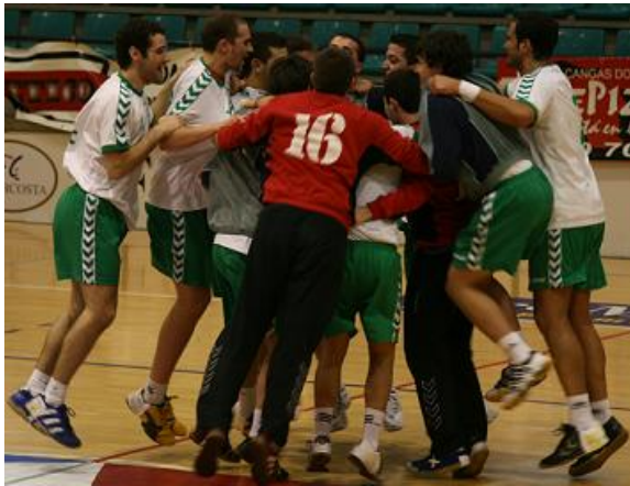
Os xogadores celebraron en Cangas a 2ª praza